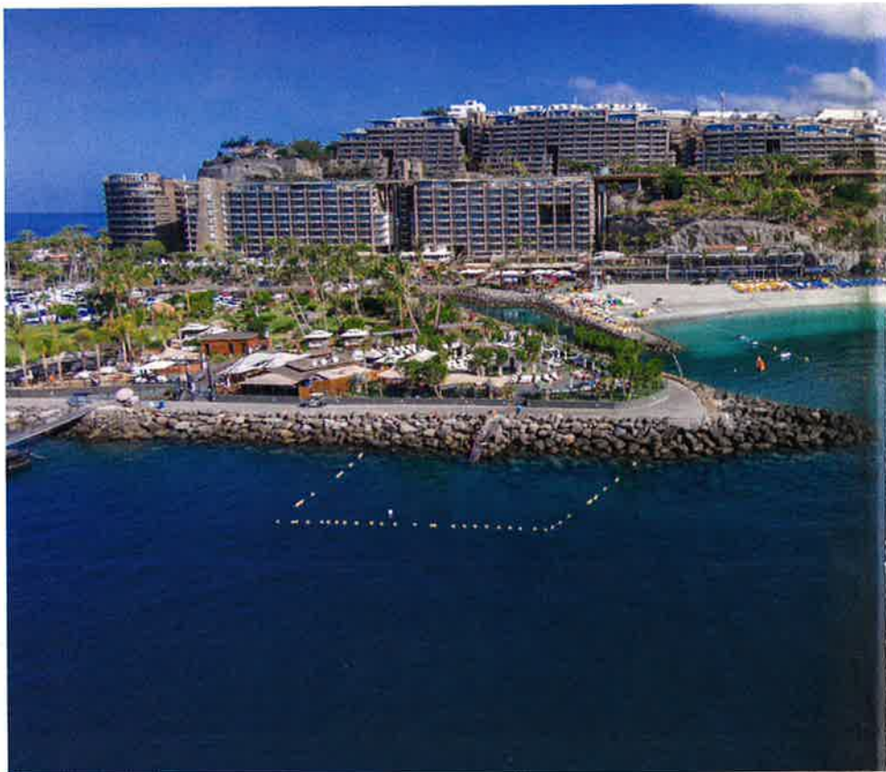
ANFI DEL MARERITT: Den hengemyra Anfi del Mar har blitt for endel timeshareeiere, er blitt god butikk for advokatfirmaet CLA.

I 2011 innførte Anfi et nytt booking-system som innebærer at det nes-